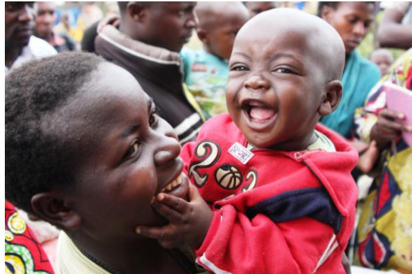
Noen tøffe måneder som sterkt underernært er over for mor og barn. Barnet var døden nær. Takket være RapidSMS har begge fått behandling tidsnok og livsgnisten tilbake!

I 2013 plasserte Time Magazine to UNICEF-ansatte på sin liste over verdens hundre mest innflytelsesrike mennesker på grunn av deres innovasjon RapidSMS. RapidSMS er et enkelt SMS-basert system som muliggjør innsamling av data og umiddelbar tilbakemelding på viktige medisinske spørsmål. Mor og barn blir registrert i en sentral server hos helsedepartementet og fulgt fra barnet er unnfanget til det har fylt to år. Den lokale helsestasjonen og distriktssykehuset har også tilgang til denne informasjonen.